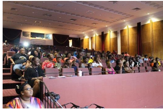
舞台演技を見つめる観客