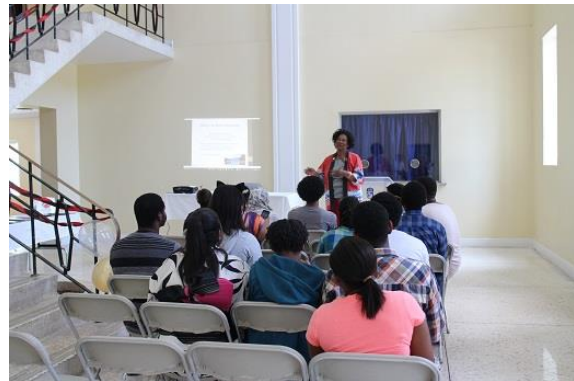
日本政府奨学金制度に関するセミナー