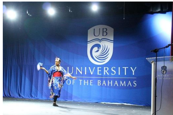
芸者の踊りの披露