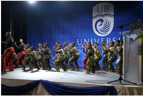
空手の演技を披露する子供たち