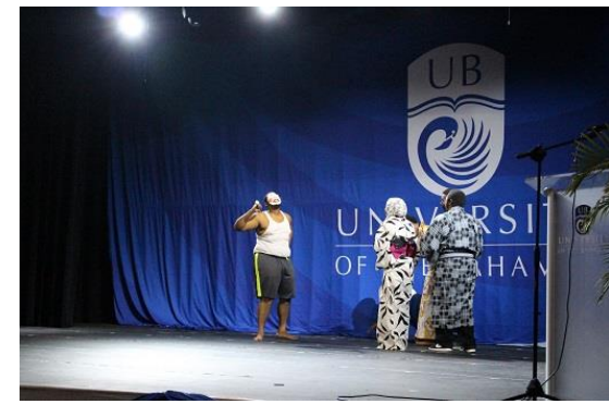
児童文学「泣いた赤鬼」を題材にした劇