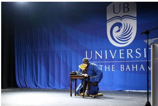
落語のスタイルによるバハマの昔話の語り